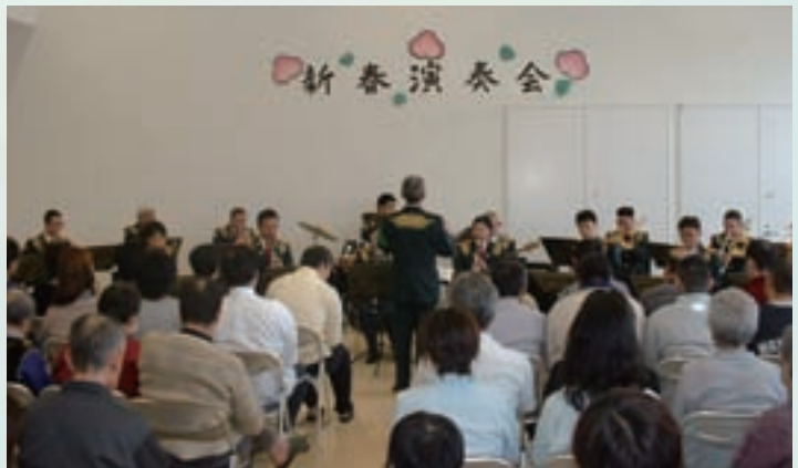
平成22年1月20日、陸上自衛隊第9音楽隊を迎え、新春演奏会が催されました。