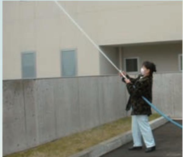
平成21年12月11日、消防訓練が実施されました。